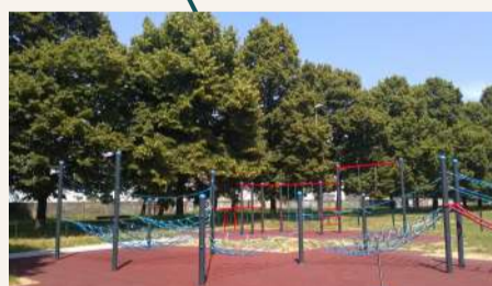
Strada delle Cacce - Spazi sociali