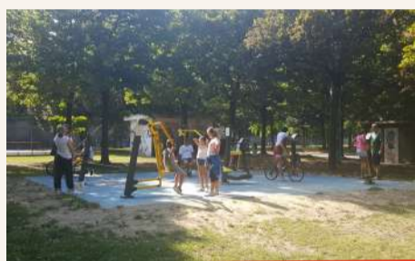
Parco Ruffini - Sport e fitness