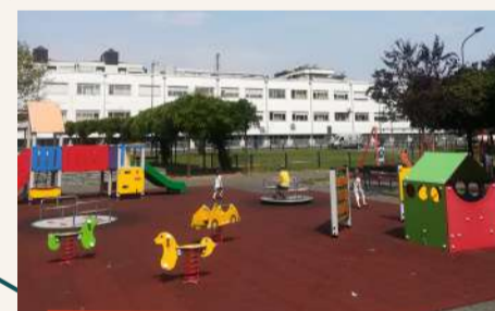
Parco di Vittorio - Nuova area gioco