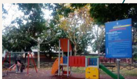
Giardini Morandi Farinelli - Riqualificazione