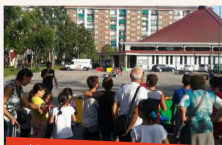
Via Negarville - Aggregazione